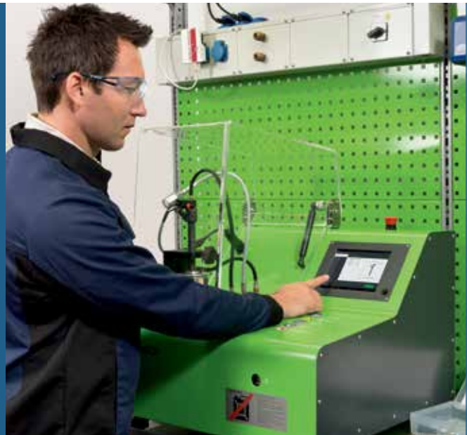
Enkel att använda via pekskärmen även utan tidigare kunskap om testning av dieselinjektorer

Andelen Common Rail-system i dieselmotorer fortsätter att öka. Nya EPS 118 ger precisionsteknik från Bosch till ett överkomligt pris, så att även mindre verkstäder kan ta del av den här växande marknaden med minimala utgifter.