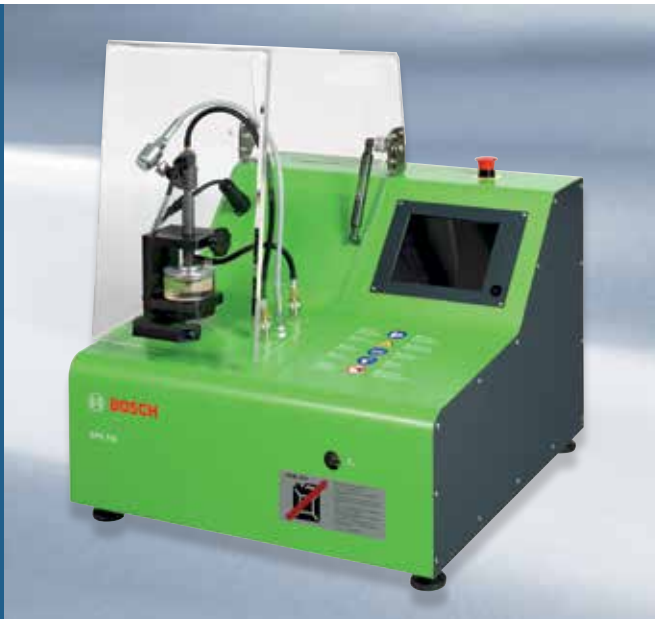
EPS 118: Platsbesparande och tålig bänkenhet med transparent kammare