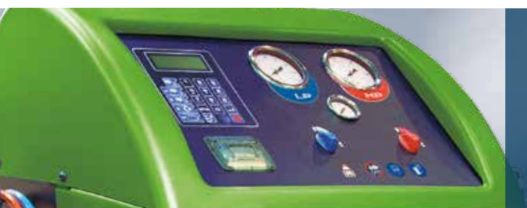
Bosch ACS 810: Specialist på stora klimatanläggningar